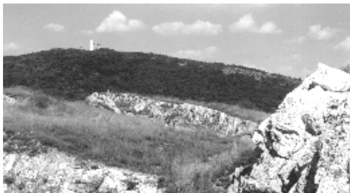
Fig. 4. SW Hungary, Villány-Hills, Tenkes, 409 m. A habitate of Isophya modestior

– Villány-Hills: Szársomlyó ridge, M8, 2001.05.31., VE; Máriagyüd, upper pasture, M8, 2001.06.31., VE; Köves-mály, M8, 2001.06.31., VE; Csukma-hegy, H3, 2001.06.31., VE; Tenkes, H4, 2001.06.13. VE; Fekete-hegy – southern slope, H3, 2001.06.14. VE.