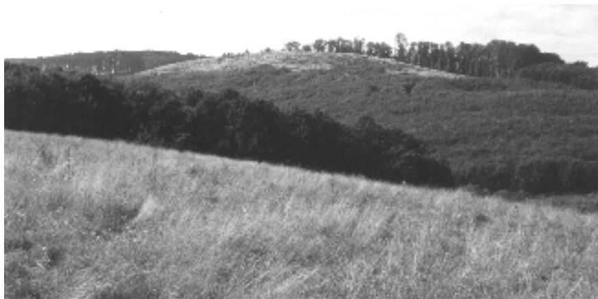
Fig. 3. SW Hungary, Mecsek-Hills, Mánfa. A habitate of Isophya brevipennis

– Mecsek: Misina, M1, 2001.06.24., VE; Remete-rét, M9, 2001.06.03., OKM; Meadow between Abaliget and Hetvehely, D3, 2001.06.01., OKM, VE, SZG; Püspökszentlászló, plateau, M9, 2001.06.09., VE; Püspökszentlászló, upper meadow, M9, 2001.06.09., VE; Püspökszentlászló, valley, D5, 2001.06.09., VE; Magyaregregy valley, E1, 2001.06.01., VE, SZG, OKM; Pécsvárad, the butts, edge, M9, 2001.06.08., VE; Mánfa, E1, 2001.06.01., VE, SZG, OKM.