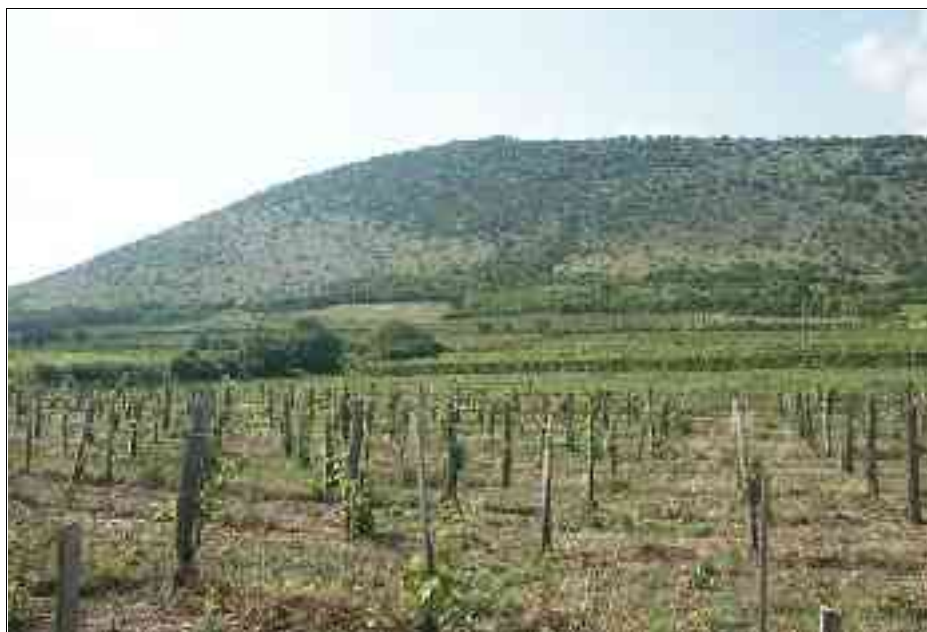
Fig. 1. SW Hungary, Villány-Hills, Szársomlyó. A habitate of Isophya modestior

Where results are presented, species name is followed by collection site, abbreviation of HGHCS category, date of collection and the abbreviation of collector's name (OKM: ORCI KIRILL Márk, SZG: SZÖVÉNYI Gergely, VE: VADKERTI Edit).